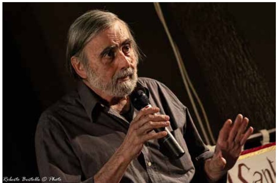
Roberto Bastella © Photo

Per info e prenotazioni contattare la segreteria: Garden Hotel viale Bramante 4/6 Terni 0744/303709 rotaryclubterni@gmail.com