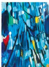
Steven Markes, Street scenes (2020) (collezione privata, olio su tela, 90x90)

Università di Camerino Scuola di Giurisprudenza